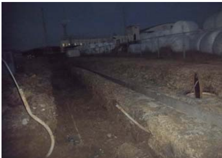
光ケーブル線切断状況

埋設管(電線管・配水管)撤去のため掘削作業中、埋設管の上を横断していた光ケーブル線をバックホウで断線。